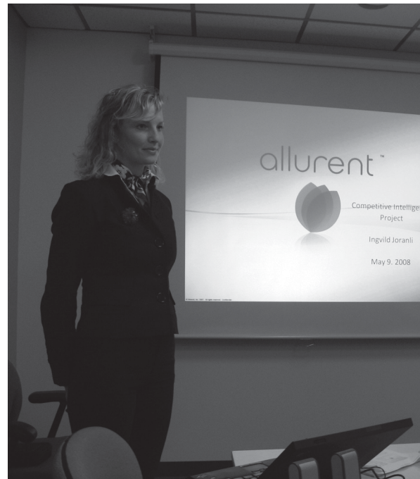
Presentasjon av konkurrentanalyse for "Allurent."

Jeg var i Boston der jeg arbeidet som marketing intern for den nyoppstartede software bedriften, Allurent.