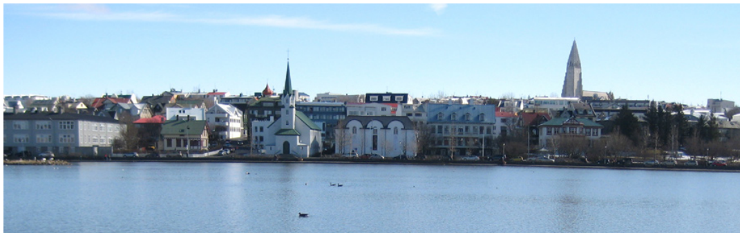
Reykjavík indre havn

Av: Helena Lindberg, bachelorstudent i samfunnsgeografi