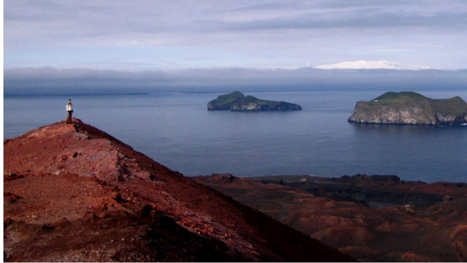
På toppen av Eldfell med utsikt mot Eyjafjallajökull

"Jeg har alltid drømt om å dra til Island!". Vel hjemme hører jeg ofte denne frasen. I disse finanskrisetider kan jeg ikke si annet til andre nordmenn: Dra! Ølen koster i dag 25 kroner fra 60 da jeg bodde der i vår, og overnattingspriser er rekordlave. Dessuten viser det seg at islendingene ikke henger med hodet, men fortsatt tar seg en velkjent "rundtur" og bjór av slaget Viking: Skál!