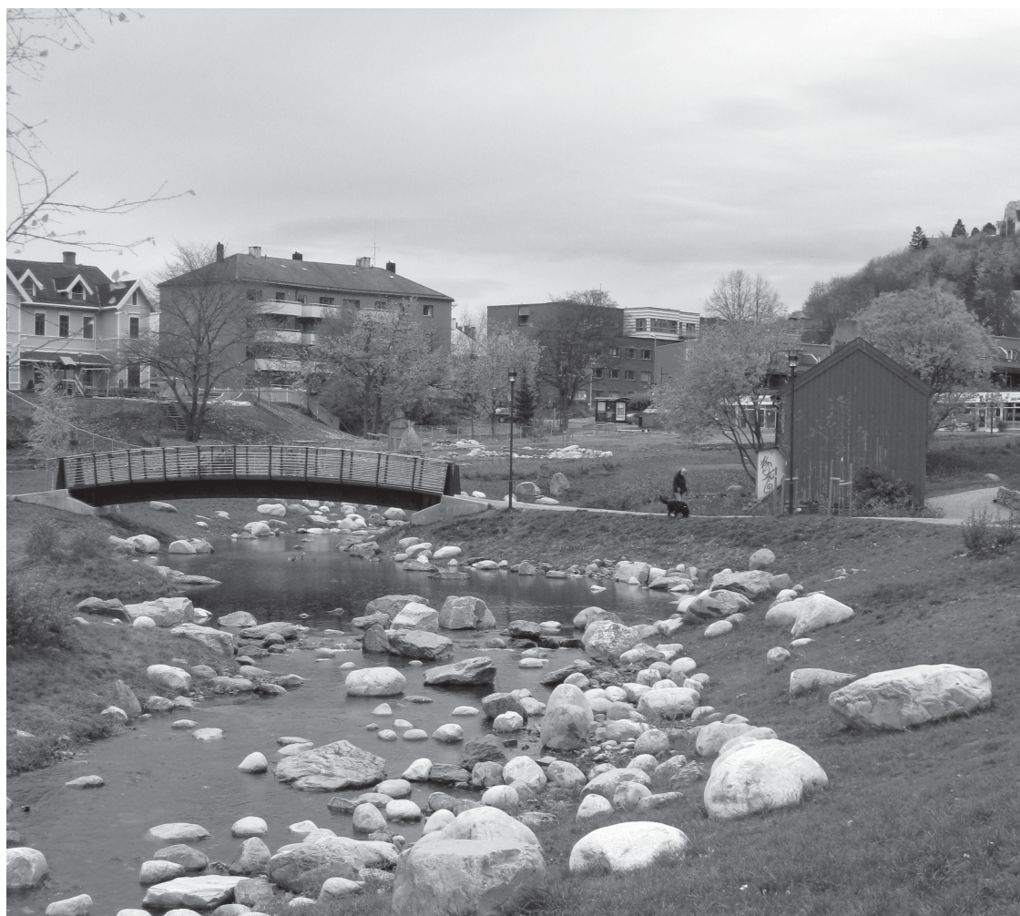
Gjenåpning av Ilabekken

http://www.boby.no/norsk_planmoete/norsk_planmoete_2008__1/presentasjoner_norsk_planmoete_2008