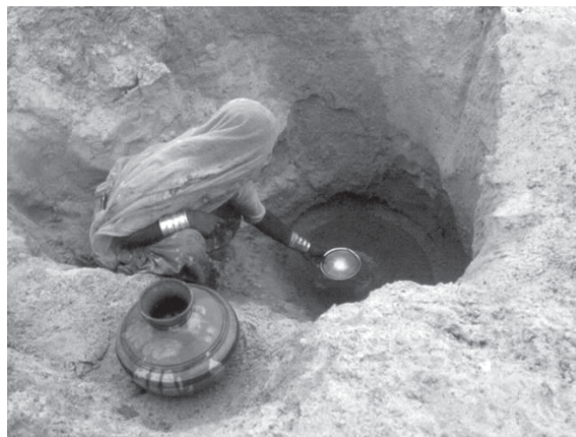
Vannkilde i de tørre områdene i India.

I klimadokumentasjonsprosjektet som GECHS har gjennomført for og i samarbeid med Utviklingsfondet, ser man på hvordan klimatilpasning kan se ut i praksis i utviklingsprosjekter. I tre prosjekter, i henholdsvis Etiopia, Nicaragua og Nepal, så man på hvordan prosjektene gjennom ulike aktiviteter kunne adressere risiko, sårbarhet og tilpasningskapasitet for fattige på landsbygda. Arbeidet har resultert i rapporten ”More than Rain: Identifying sustainable pathways for