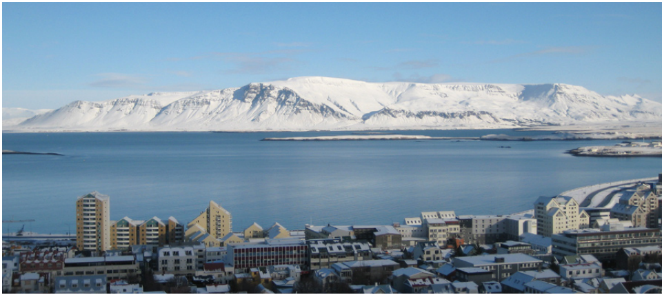
Utsikt mot Esja fra Reykjavík