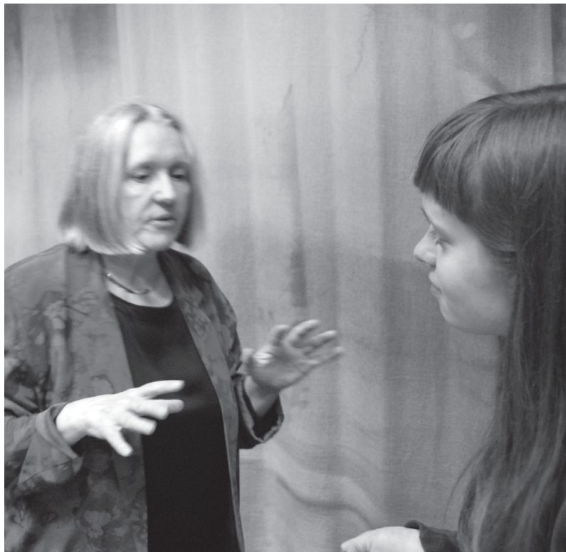
Samfunnsgeografens utsendte møtte en meget engasjert Saskia Sassen.

- Dette er en veldig spennende tid. En tid for forandringer. Våre oppfatninger om verden er i en slags ubalanse. Alle slags prosesser og institusjoner, vår forståelse, våre teorier, alt er i endring. Så den unge generasjonen har en veldig viktig rolle i å gjenkjenne alt dette, gi det navn, ta det inn i teoriene om hvordan samfunnet fungerer, avslutter hun.