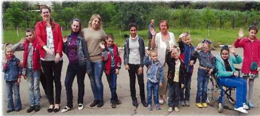
Representanter fra Key og den ordinære skole nr. 5 under felles sommerfestival 2016