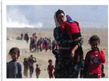
En mor og hennes tre barn på flukt bort fra krigssonen.

På det sjette året står verden fortsatt overfor den største flyktningkrisen siden andre verdenskrig. Norsk Folkehjelp er til stede på flere områder. Våre lokale partnere deler ut nødhjelp inne i Syria og i nærområdene. Vi støtter opp om organisasjoner som fortsetter sitt arbeid for fred og demokrati i dette krigsherjede landet.