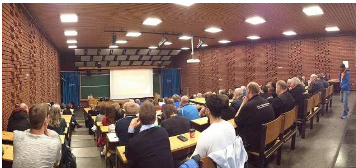
Medlemsmøte i forberedelser til mulig streik, juni 16

Deltagelse på stand i forbindelse med semesterstart.