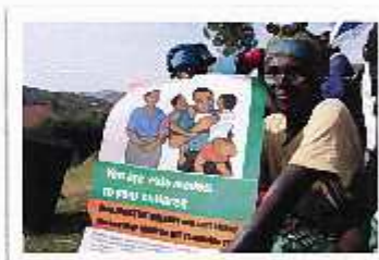
I Rwanda er det kvinnene som står vel for å få ett mer likestilt samfunn med mindre kjønnsbasert vold.

NTL og Norsk Folkehjelp arbeider sammen mot vold mot kvinner i Rwanda. Solidaritetsstøtten fra NTL bidrar til kampanjer, forsoningssamtaler og opplæring av både menn og kvinner for å bli mer likestilte. Rwanda har en konfliktfylt historie som fortsatt setter dype spor. Kvinnene er en sårbar gruppe og mange utsettes for kjønnsbasert vold. Resultatet av støtten viser en nedgang i volden.