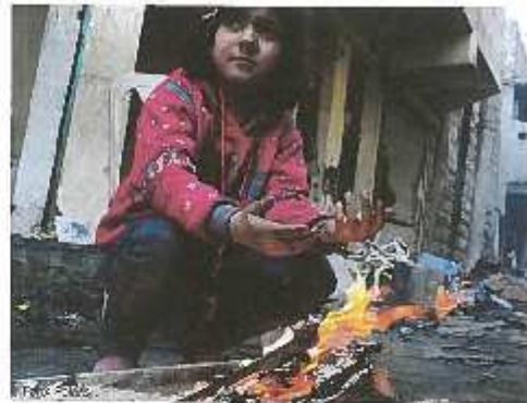
Syriske mennesker er avhengig av nødhjelp som mat og klær over hele landet gjennom vinteren.