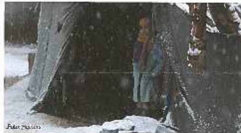
Her er en type beboelse beskytter flyktningene mot kulden, snøen og vinden.