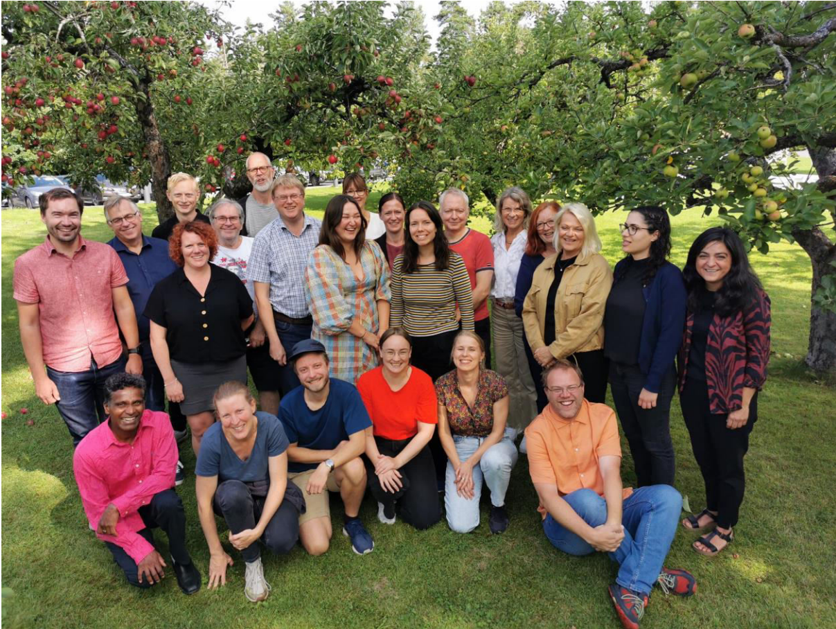
Tillitsvalgte samlet til forberedelser av lokale lønnsforhandlinger

NTL-tillitsvalgte ved UiO har møter hver tredje uke.