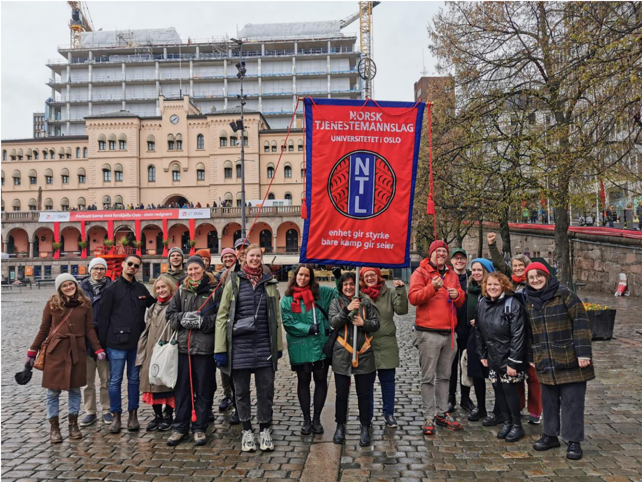
Godt oppmøte hos NTL UiO, tross en regntung 1. mai