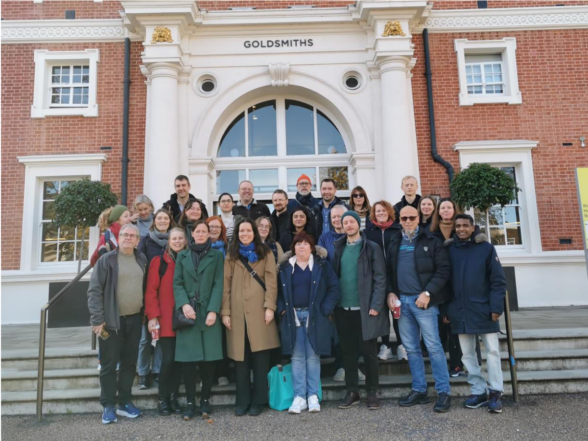
Styret og tillitsvalgte på besøk hos Goldsmiths, University of London

Styret og tillitsvalgte i foreningen var høsten 2023 på seminar i London. Der besøkte vi Goldsmiths, University of London og møtte tillitsvalgte fra UCU og Unite fra flere universiteter. Vi fikk lære om erfaringene deres med innføring av skolepenger i høyere utdanning og hvordan en stadig sterkere markedsretting har ledet til kraftig konkurranse mellom lærestedene med påfølgende forverring av både studiekvalitet og av ansattes lønns- og arbeidsvilkår.