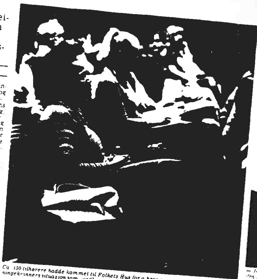
Ca 150 tilhørere hadde kommet til Folkets Hus for å høre om innvandrere og flyktningekvinner situasjon som «vedheng» i Norge.

— Jeg har 3-årig universitetsutdannelse fra Chile som sykepleier, jeg har 7 diplom fra tilleggsfag har 10 års erfaring som jordmor. Her i Norge søkte jeg på jobber som sykepleier og som jordmor. På tvilkesleddens koster fant de det ikke nødvendig at en sykepleier har universitetsutdanning. Den utdannelsen skulle jeg ha skaffet meg på en sykepleierskole eller på et nospital. De kunne derfor ikke gi meg noen jobb før jeg hadde gått tre år på sykepleierskole. De tvilte dessuten på om jeg hadde vært med på nok fødsler under utdannelsen. Et antall som steg for