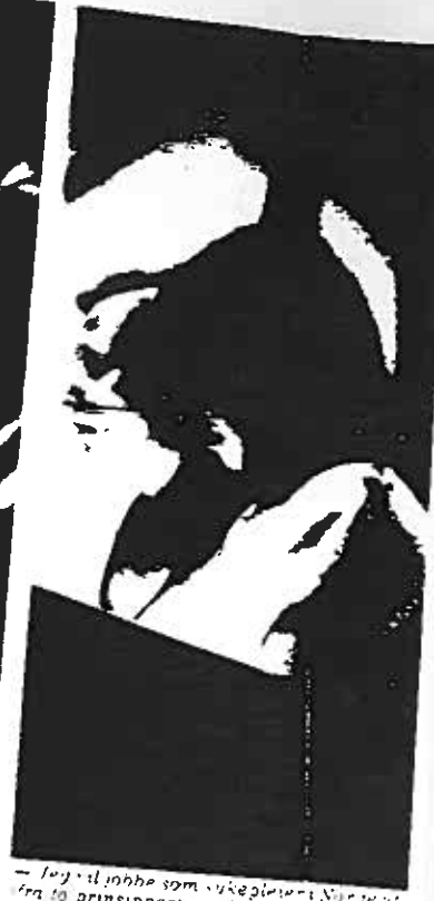
— Jeg vil ikke som sykepleier i Norge ut fra to prinsipper: og liker yrket mitt og jeg tror at Norge kan ha nytte av min utdanning og min yrkeserfaring.

hver gang jeg snakket med dem. Men med 10 års erfaring som jordmor i Chile mener jeg at min erfaring med fødsler ikke skulle være noe problem. Dette ble det ikke lagt vekt på. Jeg bestemte meg for å sende all dokumentasjon på min utdanning til Helsedirektoratet utifra to prinsipper: at jeg liker yrket mitt og at jeg tror at Norge kan nyttiggjøre seg av min utdanning og erfaring.