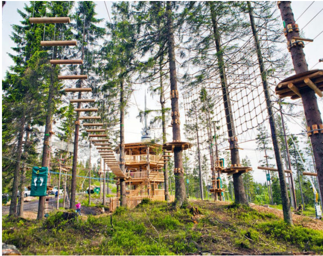
Fra Klatreparken

Klatring med guide hos Høyt og Lavt Oslo Sommerpark på Tryvann.